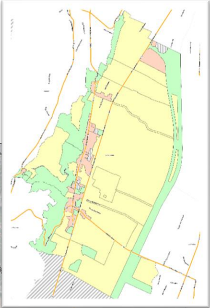
Vue d'ensemble de la commune

Type : panneaux solaires photovoltaïques + panneaux solaires thermiques Localisation : toutes les toitures de bâtiments existants et à venir sur l'ensemble de la commune