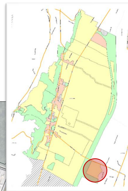
Vue d'ensemble de la commune

Type : panneaux solaires photovoltaïques au sol Localisation : parcelle cadastrée B 1542, propriétaire Electricité de France